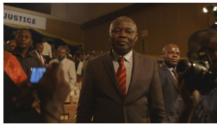
17 – Der Präsidentschaftskandidat und Experte des Tribunals Vital Kamerhe bei den „Bukavu Hearings“ / Presidential candidate and expert of the tribunal, Vital Kamerhe during „Bukavu Hearings“.