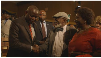
15 – Der Gouverneur von Süd-Kivu (Marcellin Cishambo, Mitte) begrüßt den Präsidentschaftskandidaten der UNC, Vital Kamerhe (l.) während der „Bukavu Hearings“ / South Kivu governor Marcellin Cishambo (centre) greets UNC presidential candidate Vital Kamerhe (left) at „Bukavu Hearings“.