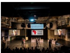
28 - Szenenbild "Das Kongo Tribunal" in den Sopheinsaelen Berlin. / Setting „The Kongo Tribunal“ at Sophiensaele Berlin.