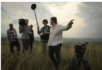
04 - Der Regisseur Milo Rau bei Dreharbeiten zum Dokumentarfilm „Das Kongo Tribunal“ mit seinem Filmteam im Ostkongo / Director Milo Rau with his film crew while shooting the documentary “The Congo Tribunal” in Eastern Congo.