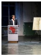
31 – Milo Rau bei seiner Eröffnungsrede zu den "Berlin Hearings". / Milo Rau delivers his opening remarks during „The Berlin Hearings“.