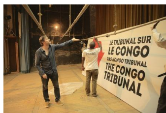
06 – Der Regisseur Milo Rau beim Aufbau des Bühnenbildes zum Theaterprojekt „Das Kongo Tribunal“ im Theater-Saal des Collège Alfajiri in Bukavu (Ostkongo), in dem Ende Mai 2015 „Das Kongo Tribunal“ stattfand. / Director Milo Rau on the stage-set of the theatre project “The Congo Tribunal” in the theatre hall at Collège Alfajiri in Bukavu, Eastern Congo, where “The Congo Tribunal” was held in late May 2015.