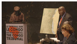
27 – Jury-Mitglied Séverin Mugangu verhört anonymen Zeugen („Die Bukavu Hearings"). / Juror Séverin Mugangu questions an anonymous witness ("The Bukavu Hearings").