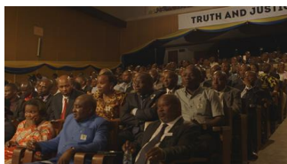
19 – Das Publikum im Collège Alfajiri („Die Bukavu Hearings“) / Audience at Collège Alfajiri („The Bukavu Hearings“).