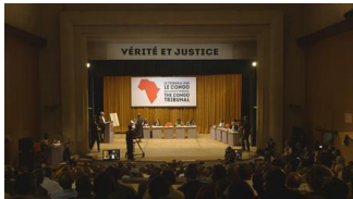
26 – „Das Kongo Tribunal“ im Theater-Saal des Collège Alfajiri in Bukavu (Ostkongo), in dem Ende Mai 2015 „Das Kongo Tribunal“ stattfand. / "The Congo Tribunal" in the theatre hall at Collège Alfajiri in Bukavu, Eastern Congo, in late May 2015.