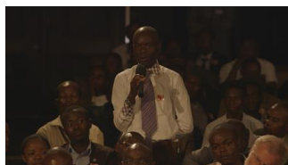
18 – Ein Zuschauer bei der Micro-ouvert-Runde nach dem Fall der Bisie-Mine („Bukavu Hearings“) / Audience member in the open-mic discussion following the Bisie mine case („Bukavu Hearings“).